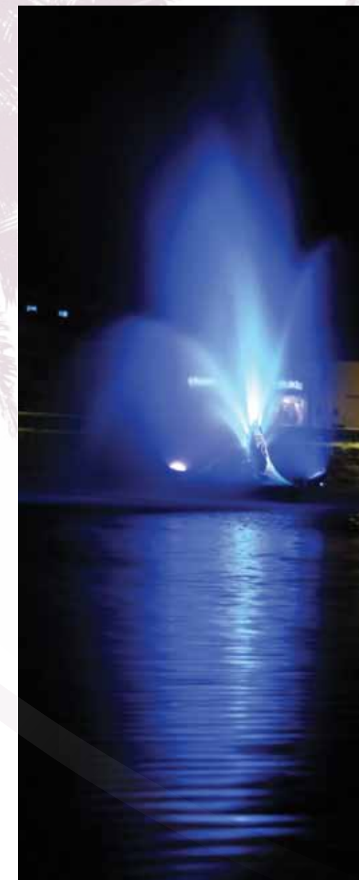
Fonte na lagoa