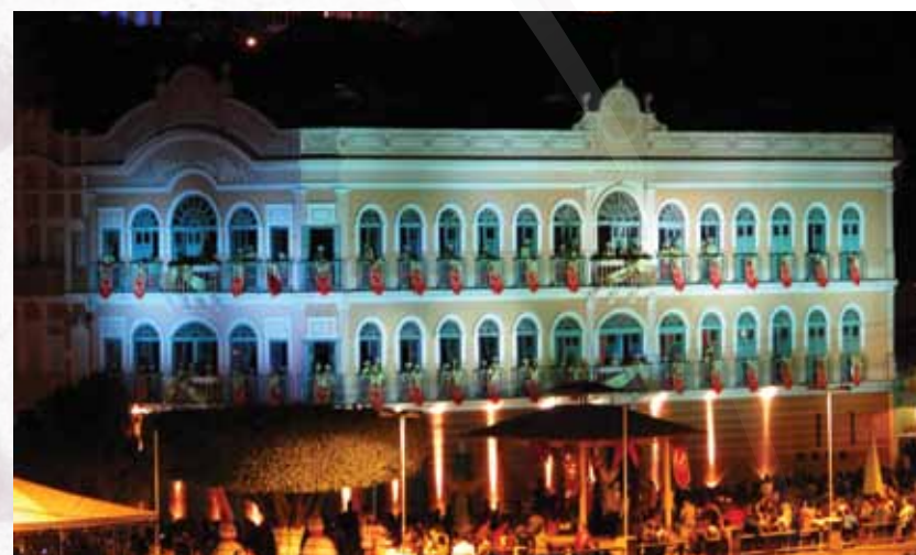
Coral Vozes do Guarany

O Cine Teatro Guarany, as margens do lago, é palco para o espetáculo do Coral Vozes do Guarany. Mais de cem crianças surgem e ocupam as janelas do imponente teatro e cantam num espetáculo que mistura a tradição natalina, luzes, efeitos especiais e muita, muita emoção.