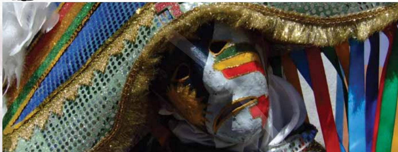
Careta de Triunfo

O medo, a curiosidade e o orgulho formam uma tríade de elementos recorrentes que, marcando as lembranças dos indivíduos envolvidos na brincadeira, dão vida e sustentação ao Carnaval triunfense. Os Caretas são figuras satíricas que transformam o carnaval de Triunfo em um dos mais irreverentes do Estado.