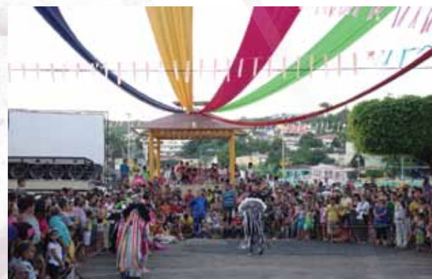
Encontro dos Caretas