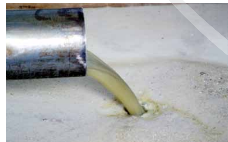
Caldo de cana

No Brasil colonial, os engenhos eram os locais destinados à fabricação de açúcar e de rapadura. Por muito tempo, a força econômica de Triunfo foi a produção da rapadura, tomando destaque nacional, sendo conhecida como a “Capital da Rapadura” em épocas áureas, com inúmeros engenhos artesanais trabalhando na confecção de rapadura e seus derivados, mas que ainda hoje são produzidos e comercializados.