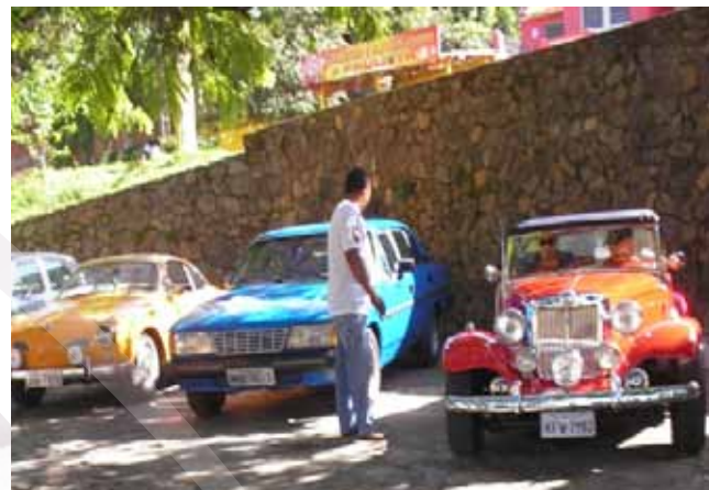
Exposição de carros antigos

Realizado desde 2010, o Encontro de Carros Antigos de Triunfo reúne colecionadores de todo o Brasil. Aproximadamente 100 veículos ficam expostos ao público, muitos pela primeira vez. Trata-se de um evento charmoso por natureza, pois reúne carros antigos e mais que isso, apaixonados por esses veículos. E é impossível ficar alheio a essa paixão. Além das raridades, os visitantes podem aproveitar todos os atrativos que a cidade de Triunfo oferece, tornando-se privilegiados por participar desse grande encontro.