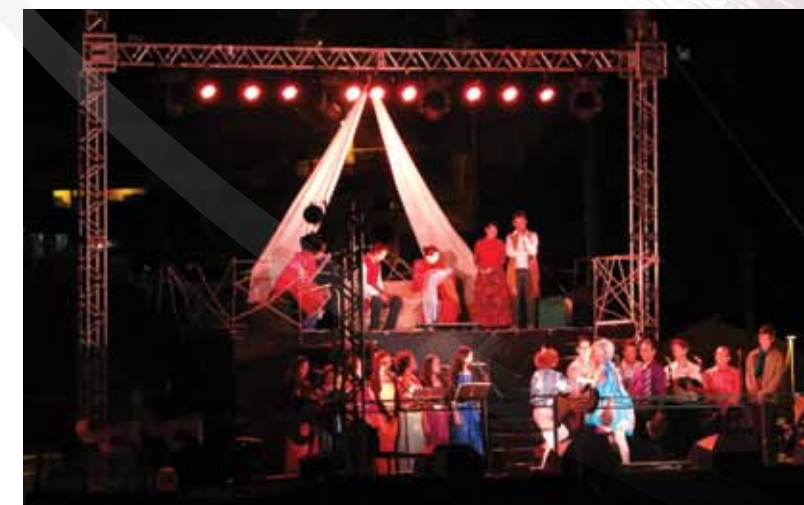
Concerto Natal Triunfo

O lago João Barbosa é o cenário para o principal espetáculo desse Natal de luzes e cores, o Concerto Natal Triunfo. Com um palco flutuante, músicos e cantores se apresentam entre as águas num Concerto Lírico com cantos religiosos e natalinos que, a cada ano, renova o repertório e a encenação.