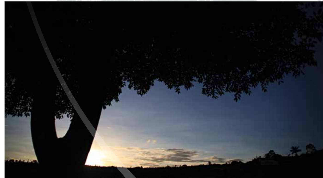
Pôr do sol

Triunfo tem como principal destaque folclórico cultural a figura do “Careta”, que desde o início do Século XX sai pelas ruas e ladeiras da cidade, chamando a atenção do público por suas máscaras, roupas e chapéus coloridos, além de uma tabuleta com chocalhos levados nas costas. O careta carrega nas mãos o relho, uma espécie de chicote.