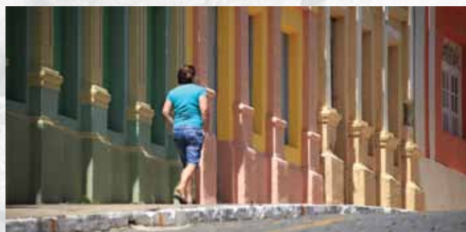
Centro Histórico de Triunfo

Triunfo possui rico patrimônio arquitetônico por ter sido colonizada por europeus. A cidade ganhou deles e dos seus ricos comerciantes do final do século XIX e início do século XX, casarões, sobrados, igrejas, conventos e escolas. Um destes patrimônios é o imponente edifício do Theatro Cinema Guarany, inaugurado em 1922, construído em torno do Lago João Barbosa Sitônio.