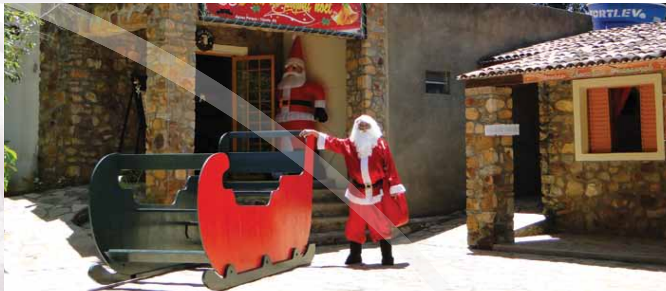
Casa do Papai Noel

São as crianças que fazem a festa para receber o símbolo do Natal, o Papai Noel. Em Triunfo ele chega pelo teleférico distribuindo presentes e fazendo a festa no encontro com a criançada.