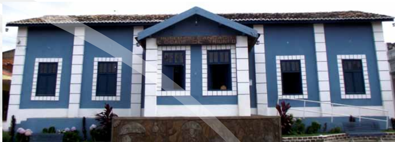
Museu do Cangaço

Com uma cultura de valorização do patrimônio histórico e do revigoramento das tradições culturais locais, Triunfo tem como destaque também arquitetônico e atrativo urbano, o prédio do Museu do Cangaço e da Cidade. No local onde estão reunidas peças da história da cidade e do tempo dos cangaceiros e do reinado de Lampião, que costumavam se esconder em Triunfo na Casa Grande das Almas, no Sítio Almas, divisa entre Pernambuco e Paraíba, e na casa de Manoel Borges. Esses locais então preservados como naquele tempo, sendo pontos de visitação.