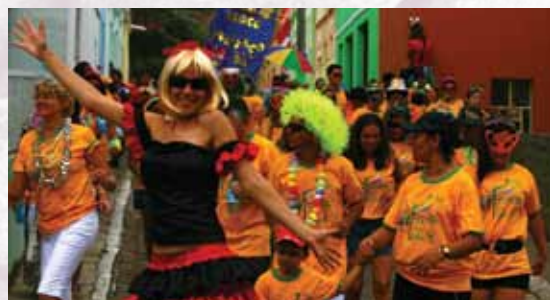
Bloco pelas Ruas

O medo, a curiosidade e o orgulho formam uma tríade de elementos recorrentes que, marcando as lembranças dos indivíduos envolvidos na brincadeira, dão vida e sustentação ao Carnaval triunfense. Os Caretas são figuras satíricas que transformam o carnaval de Triunfo em um dos mais irreverentes do Estado.