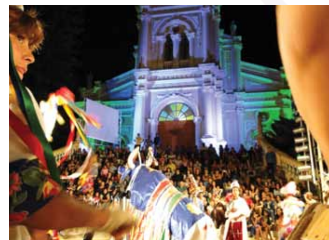
Encontro de Grupos da Tradição

A cidade se transforma no mês de dezembro em um grande cenário iluminado, um palco gigante onde a tradição oral do povo pernambucano ecoa nas vozes do pastoril, do xaxado e do reisado. Como é o caso do encontro dos grupos da tradição.