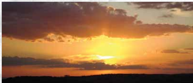
Pôr-do-sol (Pico do Papagaio)

A natureza foi bem generosa com Triunfo, detentora do ponto mais alto de Pernambuco, localizado a 9 km do centro da cidade, o Pico de Papagaio, com 1.260 metros de altitude. O local oferece aos visitantes um mirante com uma vista espetacular do Vale do Pajeú. Um lugar perfeito para respirar o ar puro do interior e se vislumbrar com o pôr do sol sertanejo espetacular.