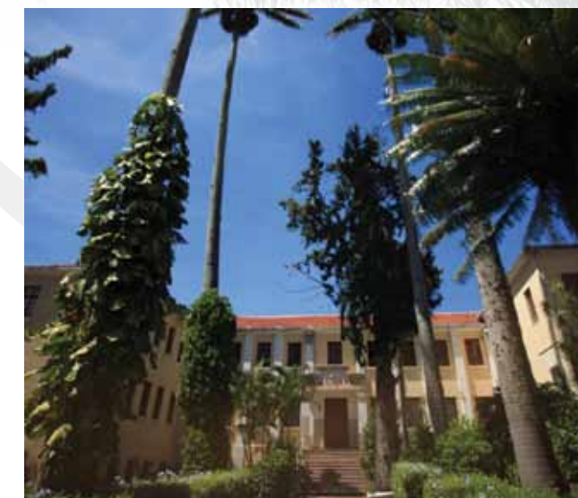
Colégio Stella Maris

Podem ser destacados: os frades franciscanos com a construção do Convento São Boaventura; o Pe. Ibiapina com a fundação da primeira casa de caridade municipal; as irmãs maristas franciscanas refugiadas da segunda guerra mundial, com a fundação do Colégio Stella Maris, contribuindo com a educação e formação de muitas gerações que passaram por Triunfo e o Lar Santa Elisabeth que faz um trabalho de assistência social em prol de crianças e adolescentes.