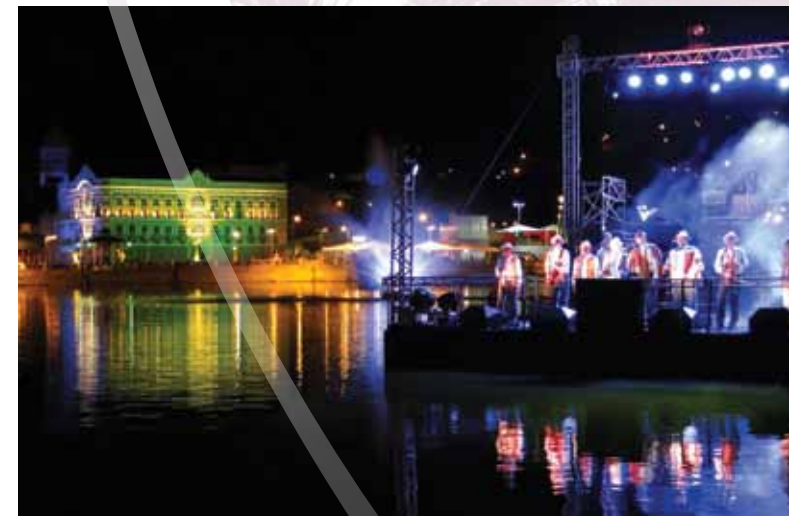
Concerto Natal Triunfo

O Natal Triunfo revela todo seu encanto e magia do Natal pela decoração específica tornando a bela arquitetura num cenário de luz e cores unindo o ciclo natalino com a religiosidade da Festa da Padroeira Nossa Senhora das Dores apresentando em sua programação uma série de espetáculos gratuitos encenados em praças da cidade, em prédios históricos, igrejas e até dentro do lago João Barbosa, outro cartão postal da cidade.