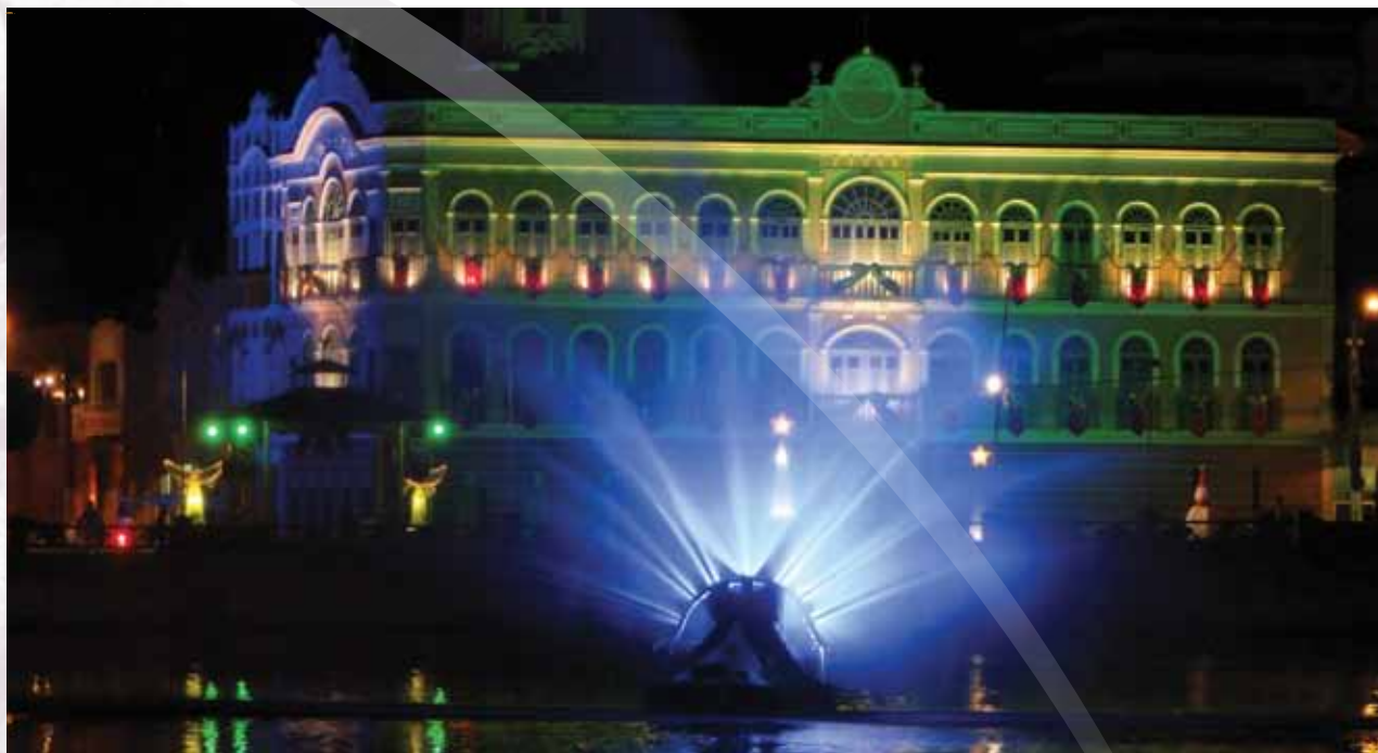
Fonte no Natal Triunfo

A tradição natalina em Triunfo se refez desde 2006 e se fortalece a cada mês de dezembro com o surgimento do Natal Triunfo, que toma conta da cidade com uma maratona de atividades envolvidos no encanto, na magia e na valorização da identidade regional, nas manifestações tradicionais e populares do ciclo natalino, com presença marcante da música lírica e da tradição oral do povo pernambucano.