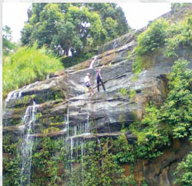
Rapel - Cachoeira dos Pingas

Para os praticantes do Turismo de Aventura, a trilha da Cachoeira do Pinga e sua decida em rapel é a ideal. O passeio oferece nível médio de dificuldade pela caatinga, onde é possível explorar rochas e uma belíssima queda d'água formando um véu de 60 metros de altura.