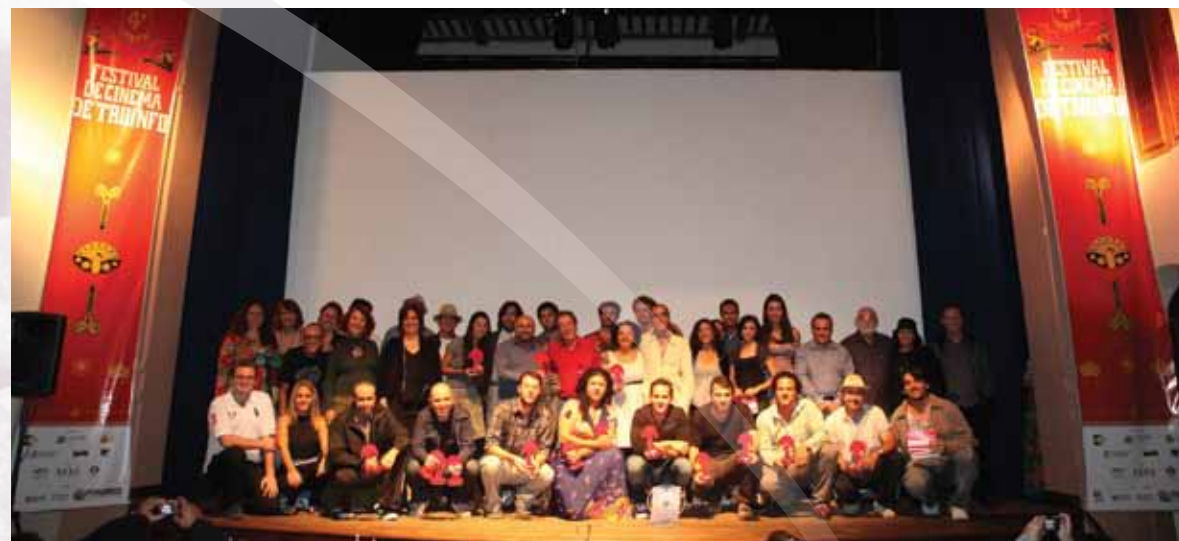
Cerimonia de premiação do Festival de Cinema de Triunfo

Triunfo se torna a capital do cinema nacional no mês de agosto. Neste período acontece o Festival de Cinema de Triunfo que é realizado desde 2008 e é considerado um dos festivais mais charmosos do País. Na disputa pelo Troféu Caretas, a competição aglomera longas e curtas-metragens.