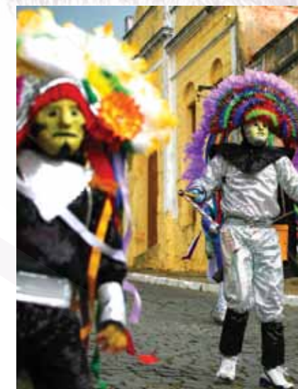
Careta de Triunfo

Divididos em grupos chamados de 'trecas', suas fantasias vão da cabeça aos pés, com máscaras feitas de papel, grude e amido de mandioca, chapéu de palha, o relho ou chicote, e a tabuleta, placa em que são escritas frases satíricas como as típicas de pára-choques de caminhão.