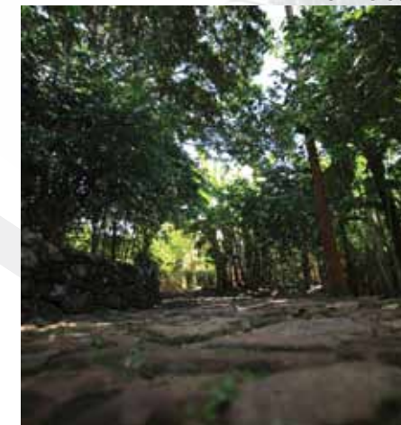
Caminhos de Pedra

Em Triunfo, o Turismo Rural e o Ecoturismo são roteiros com diversão garantida para todos os visitantes. Esses atrativos se descortinam por meio de trilhas ecológicas e belíssimas paisagens constantemente verdes. As estradas de pedras levam a cachoeiras, grutas, furnas e mirantes. A natureza exuberante justifica o título de Oásis do Sertão.