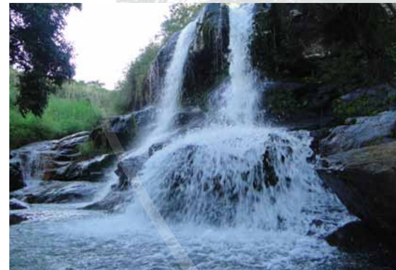
Cachoeira dos Pingas

A Cachoeira dos Pingas está localizada a 4,5 km da cidade, e possui uma beleza exuberante com seis quedas d'água. A primeira queda transforma-se numa piscina natural para um agradável banho nas águas puras e cristalinas de Triunfo.