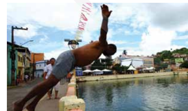
Banho no lago