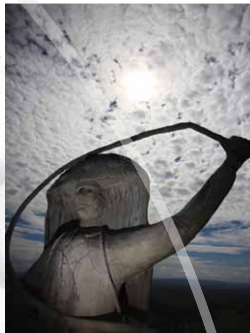
Escultura do careta no Pico do Papagaio