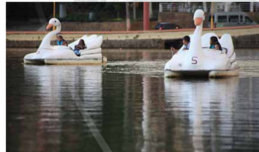
Pedalinho do Lago João Barbosa

O passeio nos pedalinhos no lago João Barbosa Sitônio atrai os visitantes que se deslumbram pelo charme e romantismo proporcionados, além de terem uma vista panorâmica da cidade.