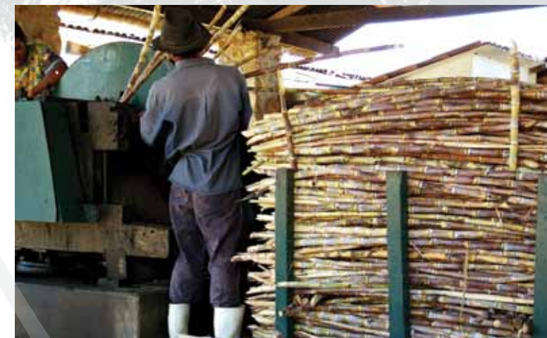
Moagem em engenho

Para os praticantes do Turismo de Aventura, a trilha da Cachoeira do Pinga e sua decida em rapel é a ideal. O passeio oferece nível médio de dificuldade pela caatinga, onde é possível explorar rochas e uma belíssima queda d'água formando um véu de 60 metros de altura.