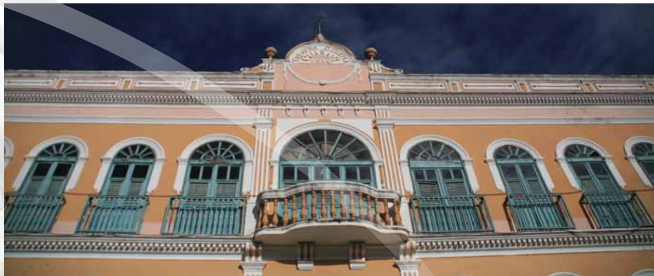
Theatro Cinema Guarany

Triunfo possui rico patrimônio arquitetônico por ter sido colonizada por europeus. A cidade ganhou deles e dos seus ricos comerciantes do final do século XIX e início do século XX, casarões, sobrados, igrejas, conventos e escolas. Um destes patrimônios é o imponente edifício do Theatro Cinema Guarany, inaugurado em 1922, construído em torno do Lago João Barbosa Sitônio.