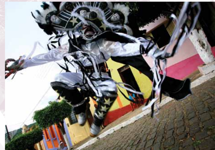
Careta de Triunfo

As máscaras dos Caretas podem até não estampar um sorriso, mas eles são a representação máxima da alegria e da tradição do Carnaval de Triunfo. Os mascarados representam o principal personagem do carnaval triunfense há mais de 90 anos, e que consolidaram o carnaval de Triunfo o melhor festejo de momo do interior do Estado de Pernambuco.