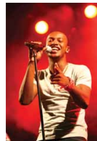
Show Exalta Samba

Além da brincadeira, o carnaval triunfense ainda conta com blocos de frevo, cortejos de grupos de cultura popular, shows e com o tradicional banho no Lago João Barbosa Sitônio. Mesmo com as caras amarradas dos folclóricos Caretas, a folia de Triunfo é marcada por animação e muita festa.