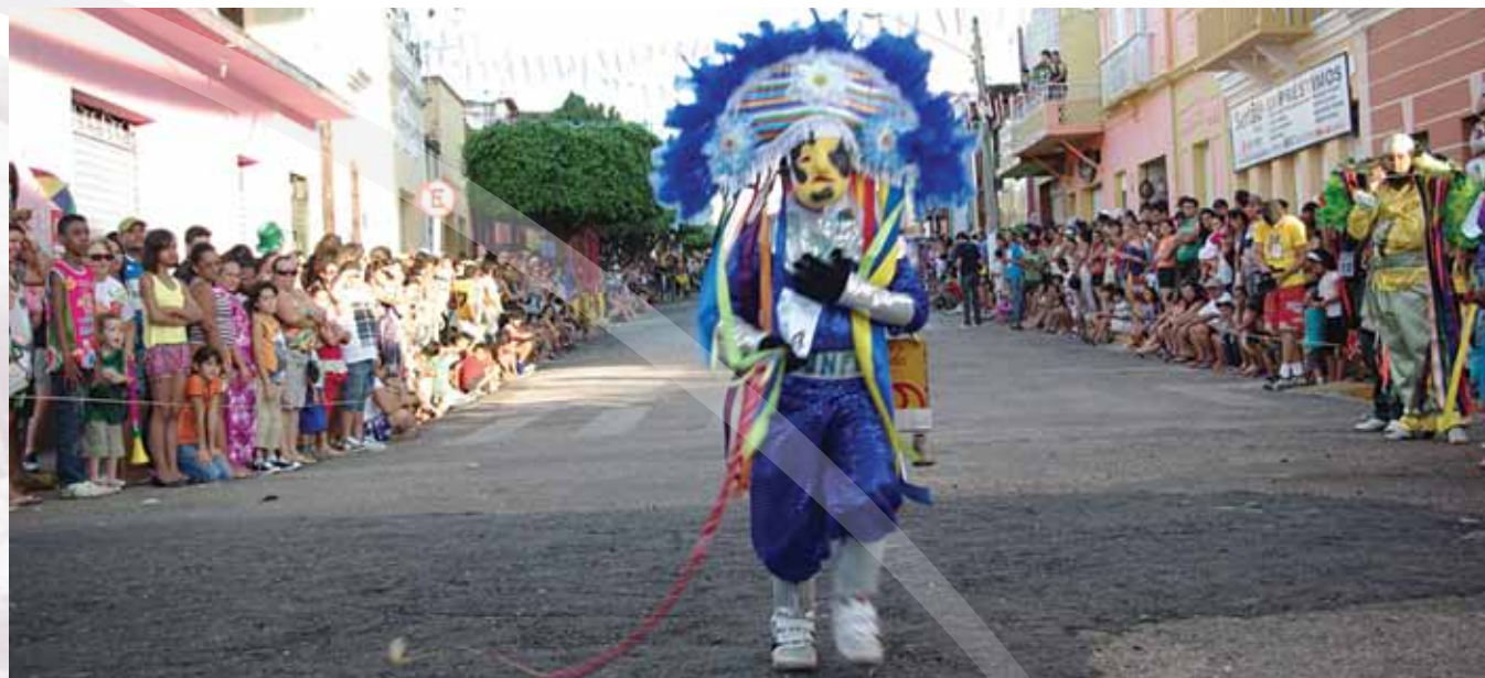
Encontro dos Caretas

Todo ano, os melhores caretas são premiados em um concurso promovido na segunda-feira de carnaval, por isso, as fantasias tentam se tornar mais criativas e caprichosas.