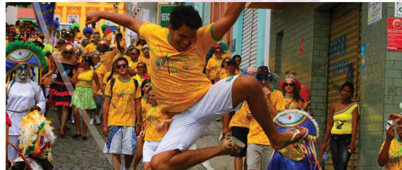
Tradicional Bloco de Rua

Além da brincadeira, o carnaval triunfense ainda conta com blocos de frevo, cortejos de grupos de cultura popular, shows e com o tradicional banho no Lago João Barbosa Sitônio. Mesmo com as caras amarradas dos folclóricos Caretas, a folia de Triunfo é marcada por animação e muita festa.