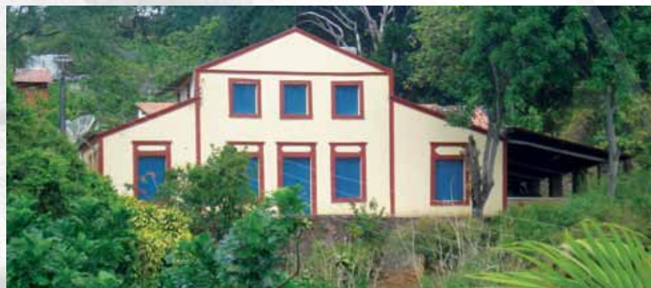
Casa de Manoel Borges

Com uma cultura de valorização do patrimônio histórico e do revigoramento das tradições culturais locais, Triunfo tem como destaque também arquitetônico e atrativo urbano, o prédio do Museu do Cangaço e da Cidade. No local onde estão reunidas peças da história da cidade e do tempo dos cangaceiros e do reinado de Lampião, que costumavam se esconder em Triunfo na Casa Grande das Almas, no Sítio Almas, divisa entre Pernambuco e Paraíba, e na casa de Manoel Borges. Esses locais então preservados como naquele tempo, sendo pontos de visitação.