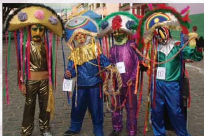
Encontro dos Caretas

Todo ano, os melhores caretas são premiados em um concurso promovido na segunda-feira de carnaval, por isso, as fantasias tentam se tornar mais criativas e caprichosas.