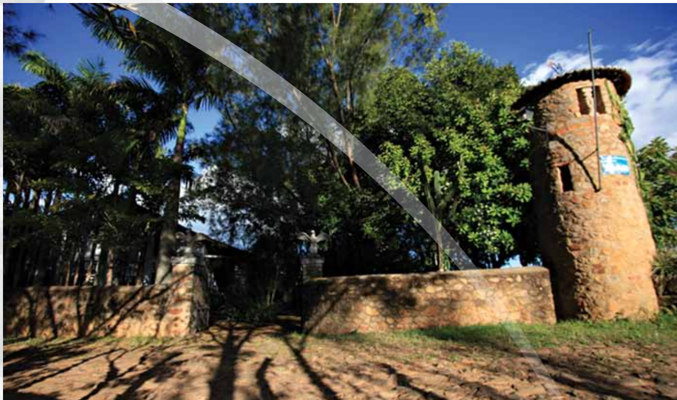
Casa Grande das Almas

“A palavra Triunfo por si própria já poderia nomear um lugar. Mas nesse caso não chega a ofuscar a qualidade e estranheza dessa cidade serrana de Pernambuco. Sobretudo os muros de pedra, porque lá só se encontram cercas com muros de pedras soltas. Certos dias enevoados, as paisagens nos levam a crer que estamos numa região muito próxima do encantamento, como tenho tentado captar nos quadros que pinto há anos sobre Triunfo.” O depoimento de Francisco Brennand, um dos maiores artistas plásticos do Brasil.