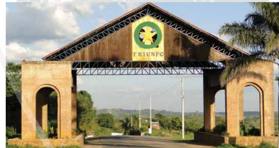
Pórtico via Serra Talhada

“A palavra Triunfo por si própria já poderia nomear um lugar. Mas nesse caso não chega a ofuscar a qualidade e estranheza dessa cidade serrana de Pernambuco. Sobretudo os muros de pedra, porque lá só se encontram cercas com muros de pedras soltas. Certos dias enevoados, as paisagens nos levam a crer que estamos numa região muito próxima do encantamento, como tenho tentado captar nos quadros que pinto há anos sobre Triunfo.” O depoimento de Francisco Brennand, um dos maiores artistas plásticos do Brasil.