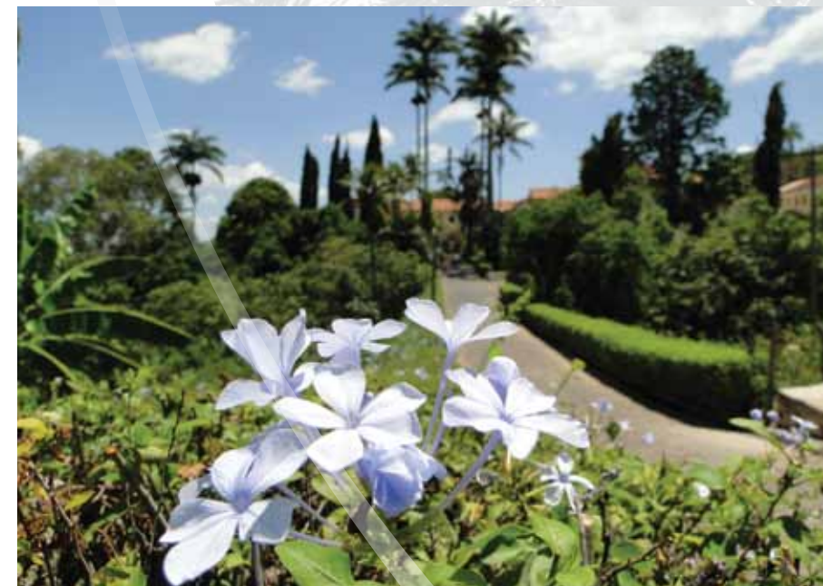
Colégio Stella Maris

Recentemente, a Cachaça Ecológica Triunpho foi a primeira do Brasil a receber o selo de qualidade do INMETRO.