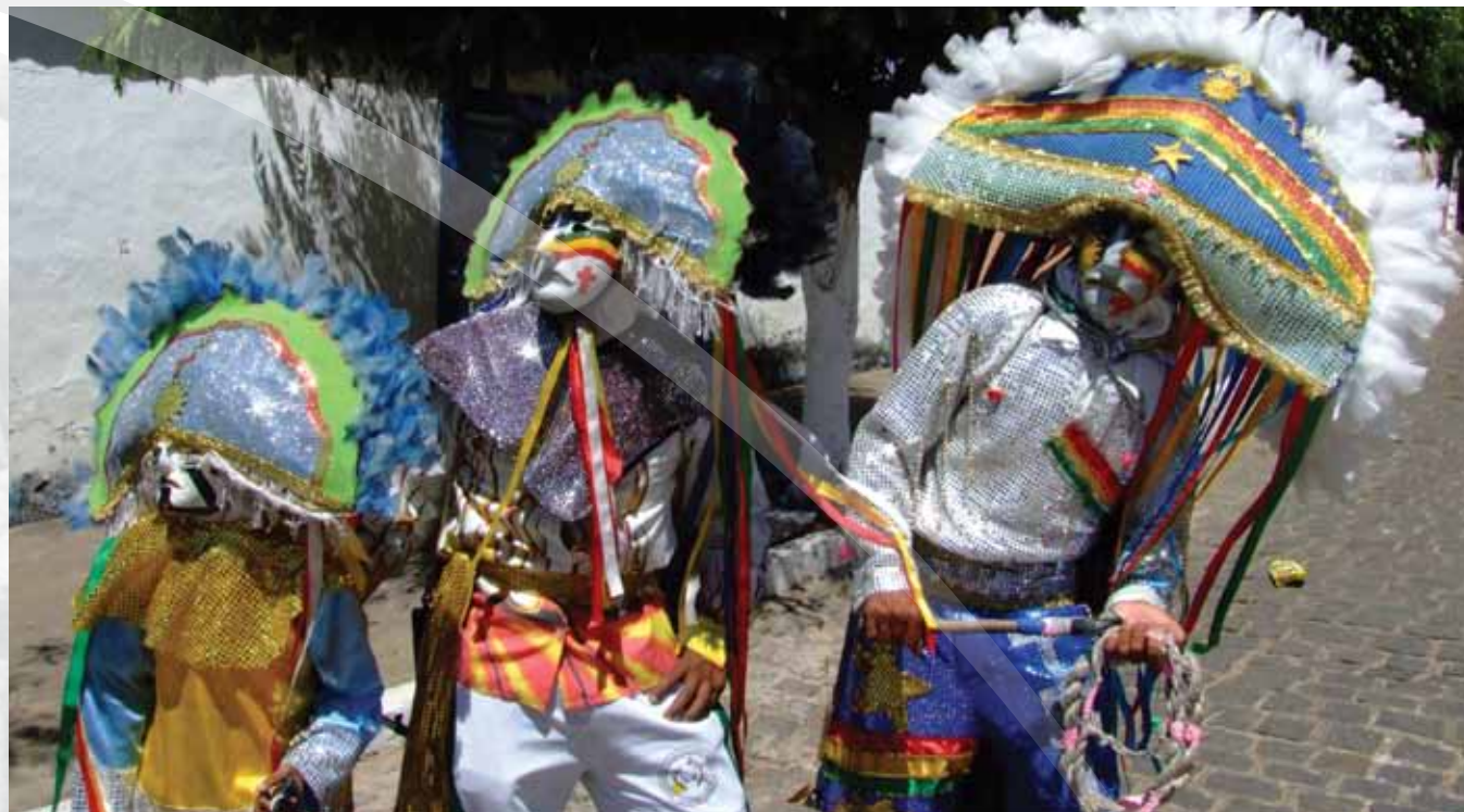
Caretas de Triunfo