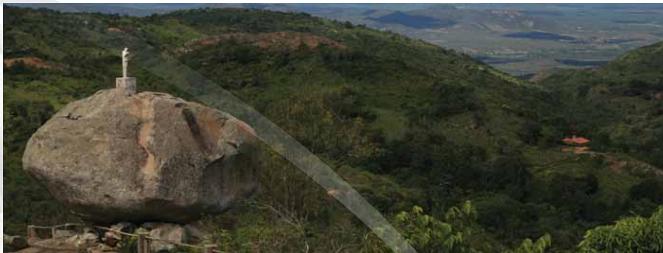
Pico do Papagaio

A natureza foi bem generosa com Triunfo, detentora do ponto mais alto de Pernambuco, localizado a 9 km do centro da cidade, o Pico de Papagaio, com 1.260 metros de altitude. O local oferece aos visitantes um mirante com uma vista espetacular do Vale do Pajeú. Um lugar perfeito para respirar o ar puro do interior e se vislumbrar com o pôr do sol sertanejo espetacular.