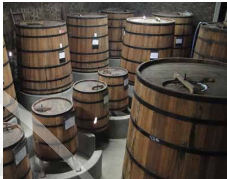
Adega da cachaça Triunfo

Da exploração da cana-de-açúcar, a cidade firmou-se também na produção da Cachaça Ecológica Triunpho. A Cachaça Triunpho destilada em alambique e envelhecida em barris de carvalho possui características singulares de aroma e sabor, propiciadas pelo cultivo da cana e ritual de produção em região de terras altas, acima de 1000 metros de altitude.