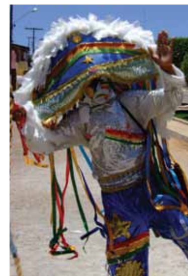
Careta de Triunfo

Divididos em grupos chamados de 'trecas', suas fantasias vão da cabeça aos pés, com máscaras feitas de papel, grude e amido de mandioca, chapéu de palha, o relho ou chicote, e a tabuleta, placa em que são escritas frases satíricas como as típicas de pára-choques de caminhão.